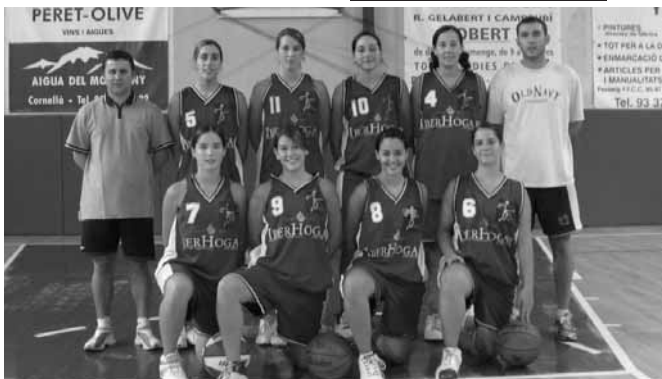
El Cadet A femení Iberhogar Cornellà

L'entrevista completa a: www.basquetcornella.com