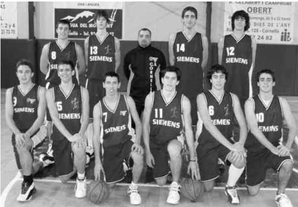
El Júnior masculí Siemans Cornellà