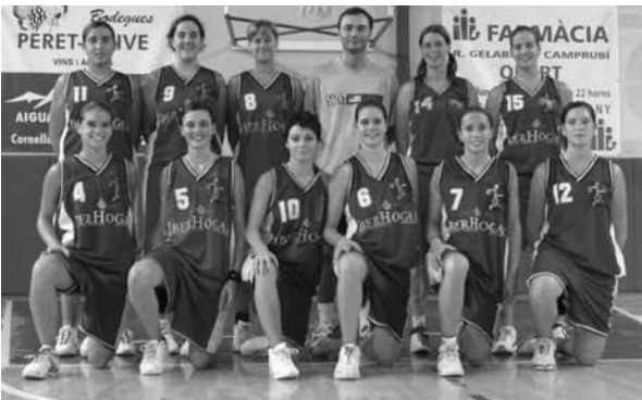
La plantilla del Júnior femení Iberhogar Cornellà

Ardèvol: Crec que ha estat una primera fase difícil, no per resultats, ja que hem guanyat molts partits de forma abultada i tenim un dels millors bàsquet average de la categoria, sinó perquè des d'un principi es donava per descomptat que ens haviem de classificar. Jugar amb aquesta pressió afegida de vegades resulta molt complicat. A més, el fet de guanyar partits amb molta diferència fa que t'acabis acomodant i no juguis al més alt nivell, aquest aspecte també ens ha dificultat una mica el tram final d'aquesta primera fase de competició.