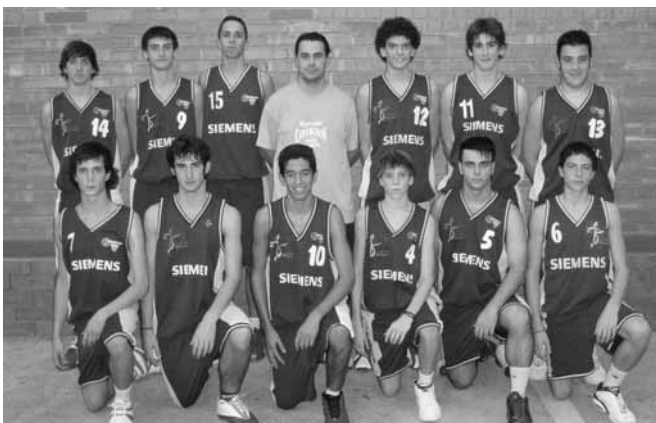
Els jugadors del Cadet masculí Siemens Cornellà

mateixes lluitarem per aquestes places que donen accés al grup definitiu dels sis millors equips de la categoria i el dret a lluitar per un lloc a la Final a 4. Crec que dependrà molt de nosaltres mateixes entrar o no en el grup definitiu. Tenim qualitat per poder-hi ser, però haurem de competir al més alt nivell. Tinc confiança en l'equip i crec que ho aconseguirem.